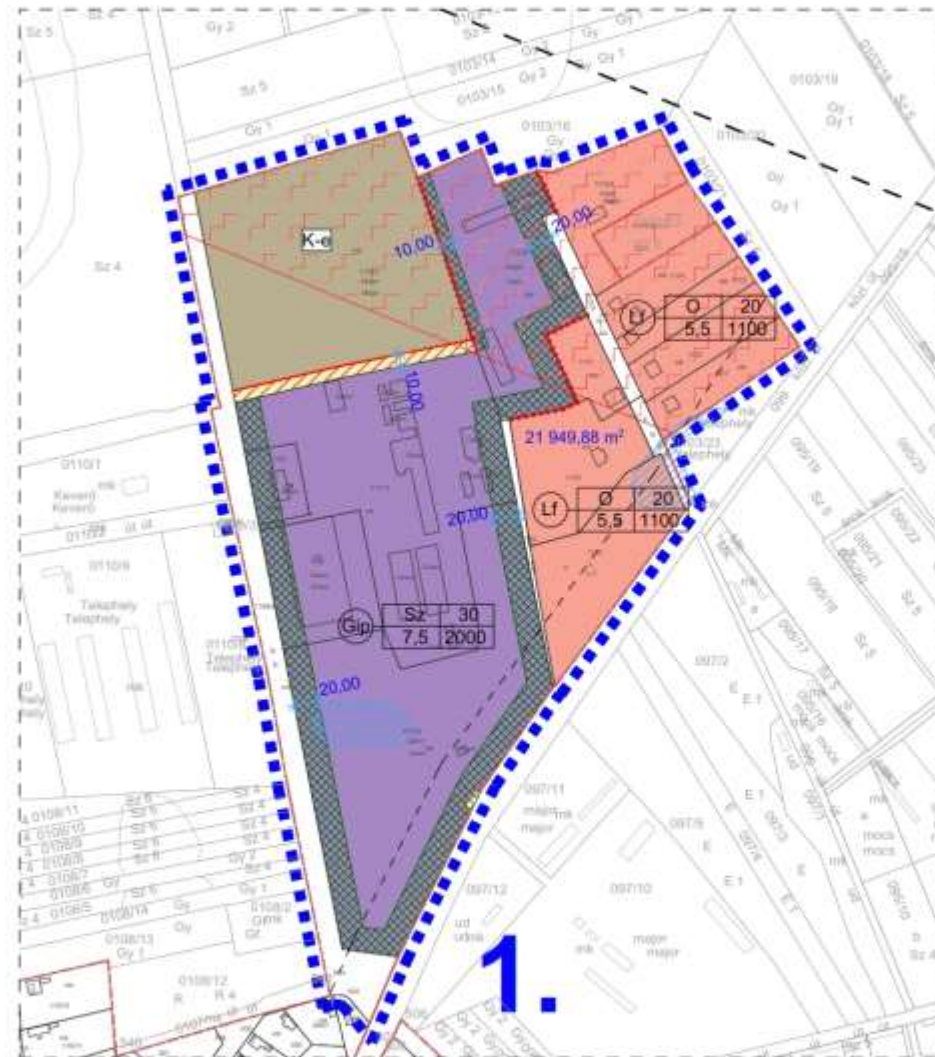
Hatályos terv részlete!